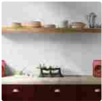
KEF LSX, completamente stereo e wireless per gli Uni-Q addicted