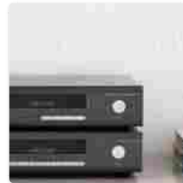
Tra il classico e il moderno – Arcam serie HDA: CDS50, SA10, SA20