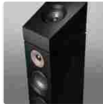
JAMO Studio 8, gli speaker raffinati e versatili, perfetti per i trend moderni